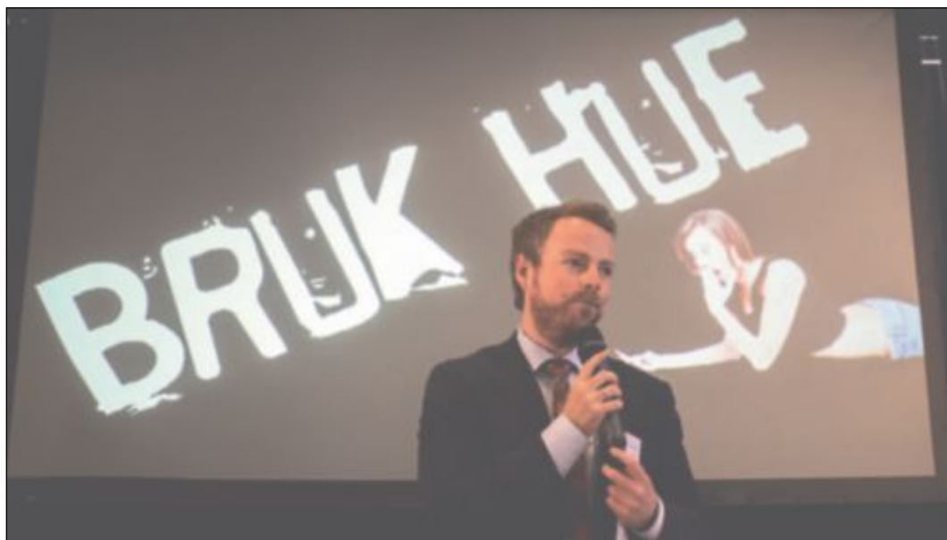
Kunnskapsminister Torbjørn Røe Isaksen vil ha færre utdanningsinstitusjoner, men i den prosessen må han og andre også makte å bruke fornuften. Illustrasjonsfoto

Er det realistisk å tro at de vil forvalte dette ansvaret på en måte som går i landsdelens favør?