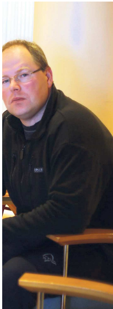
ikke får fortsette på egen kjø. - Når regjeringen /skolen.